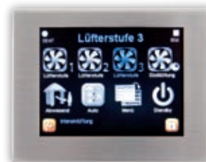
TFT dotykový displej