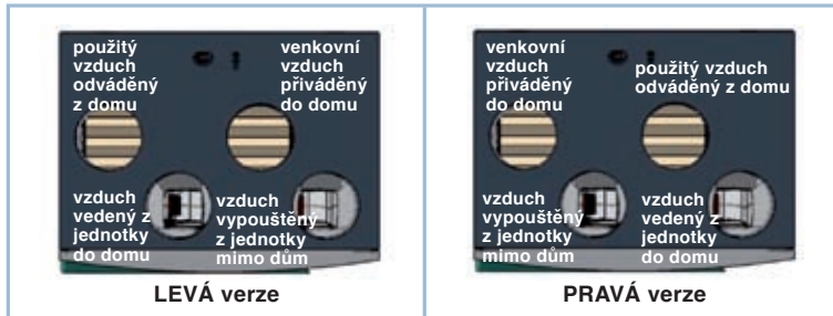
Obr. 1: Varianty

Paul Wärmerückgewinnung GmbH August-Horch-Str. 7, 08141 Reinsdorf, Německo