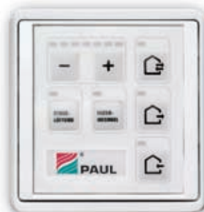
LED – řídicí jednotka manuální ovládání prostřednictvím dotykové klávesnice